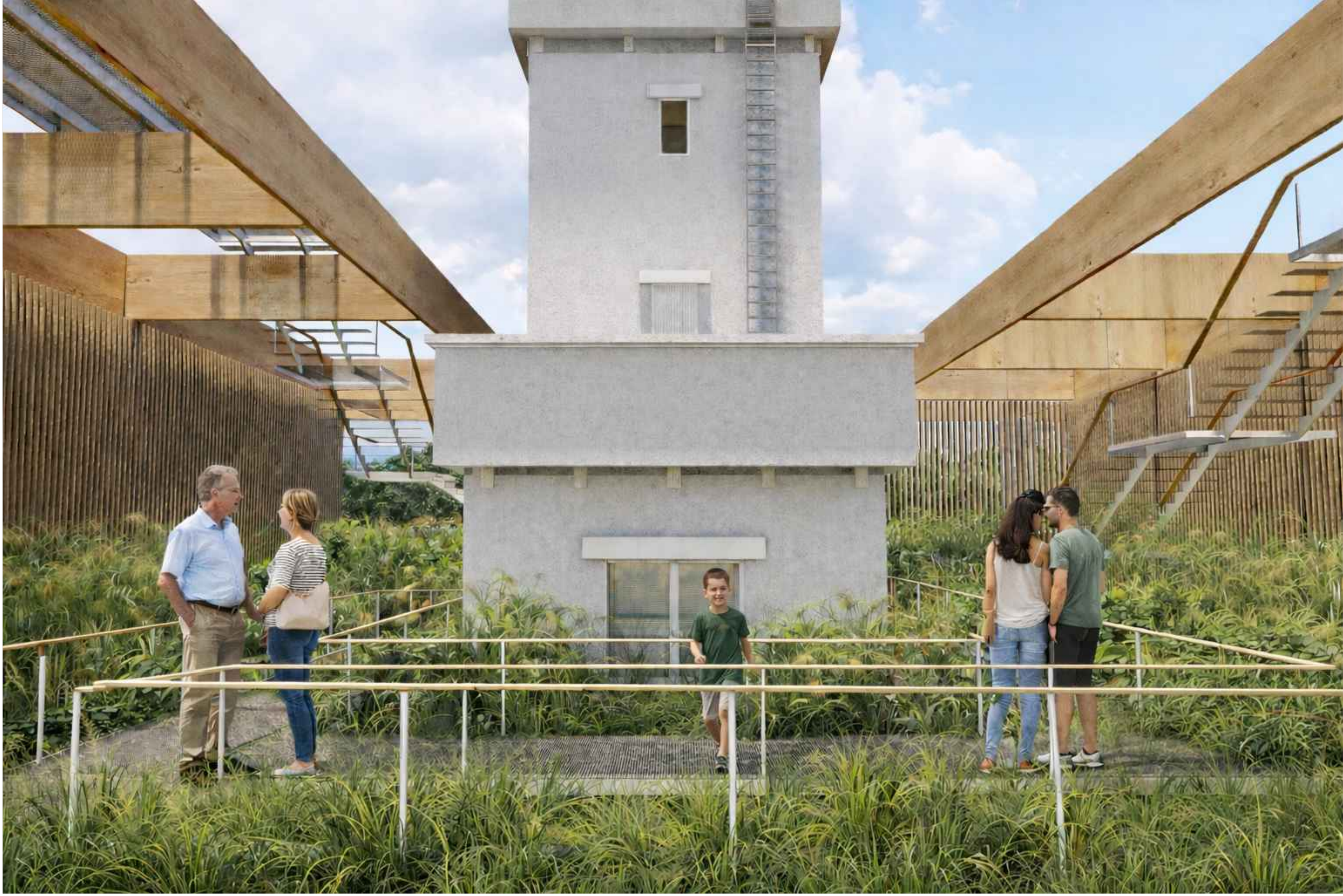
RENDER EXTERIOR DE ESPACIO DE REINTERPRETACION